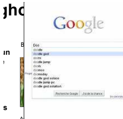
Un Doodle mystère pour annoncer la recherche en temps réel sur...

On en parle : internet • smartphone • wos • google • téléchargement illégal • hacker • Bioethanol Sans Odeur ni Fumée - Look Design Ni Centre ni Entretien Biofactory.fr/Bioethanol