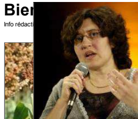
Changement climatique : "des faits scientifiques qui d..."